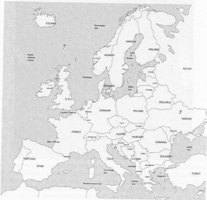
Locația Finlandei în Europa.

La momentul în care Simo a ajuns pe poziția sa, lumina era încă slabă; era aproape întuneric. În jur, în acea zonă de provincie, era liniște, fapt ce i-a permis lui Simo să-și adună gândurile și să se pregătească pentru misiune corespunzător. Pentru că acționa solitar, departe de liniile aliate, nu își permitea să